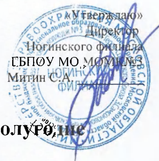
График производственной практики на 2 полугодие 2020-2021 учебного года